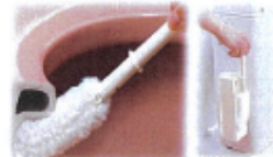
トイレクリーナー