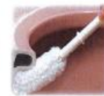
トイレクリーナー